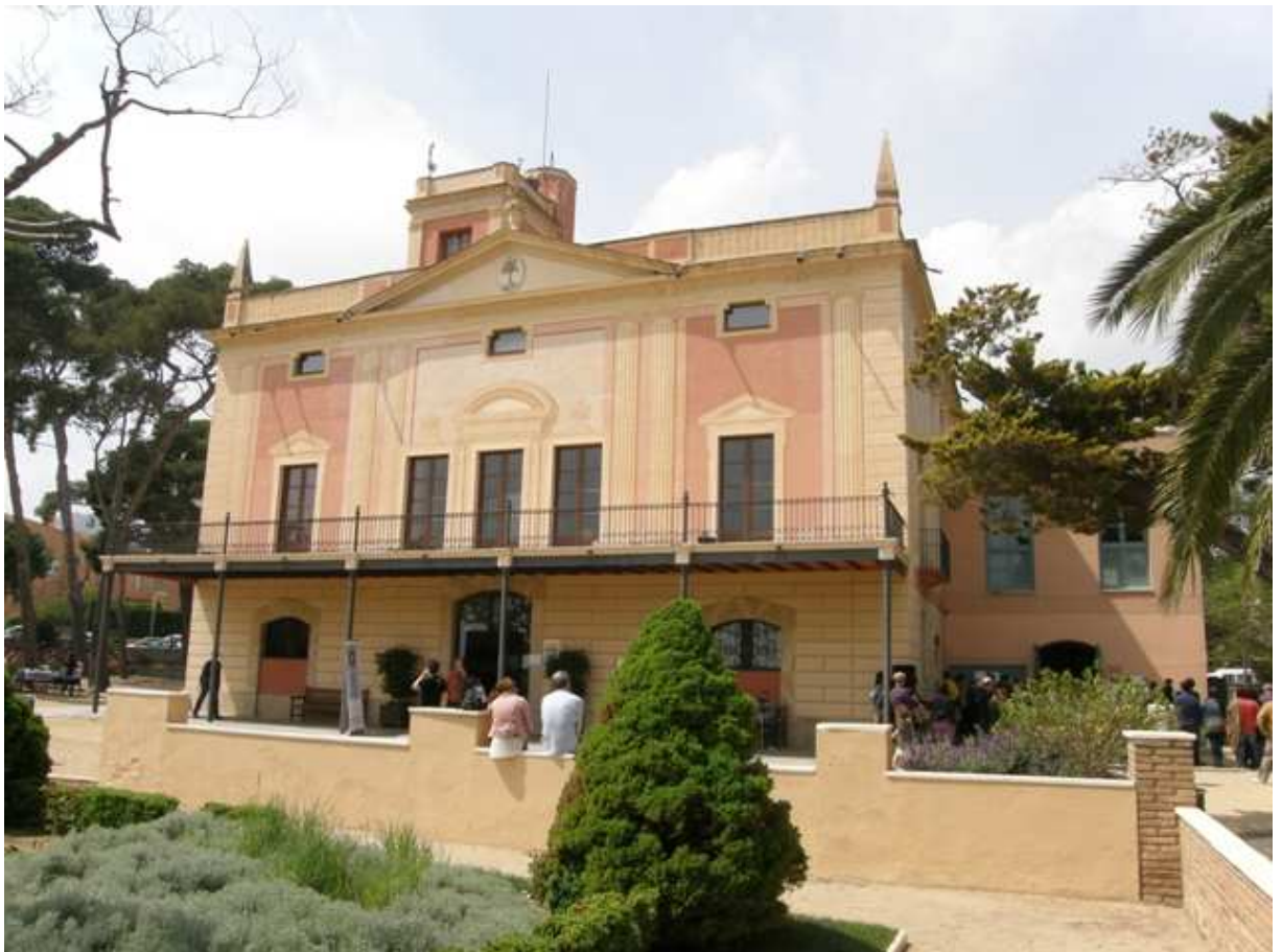
Hort d'Iglésies, La Selva del Camp