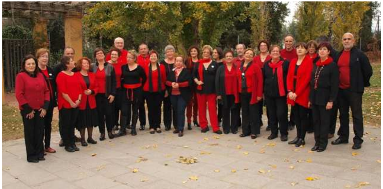
Coral Veus de la Terra